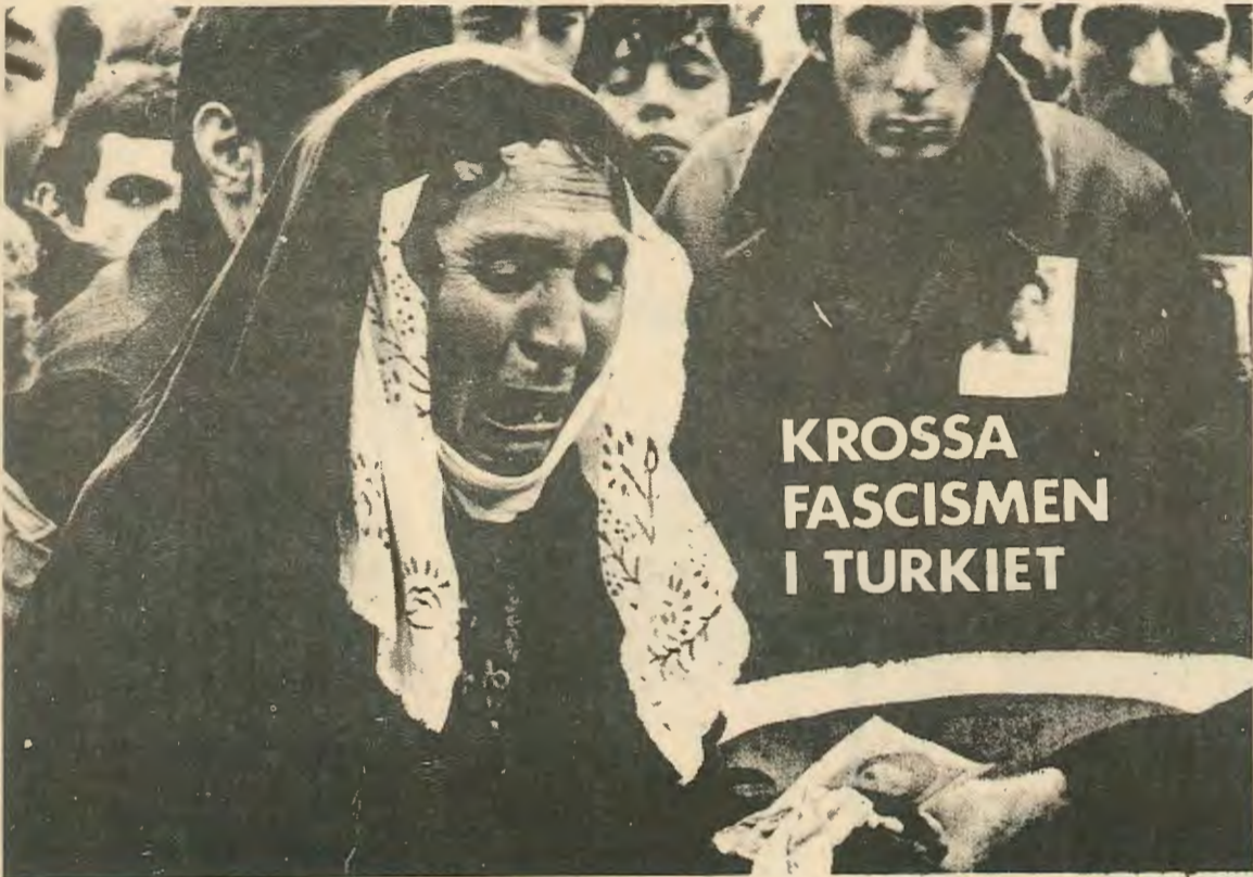
ΚΑΤΩ Ο ΦΑΣΙΣΜΟΣ ΣΤΗΝ ΤΟΥΡΚΙΑ

Στο μεταξύ άρχισε και ο αντιαμερικανισμός στην Τουρκία με διαδηλώσεις και άλλες εκδηλώσεις. Και έτσι, από την μία το Κομμουνιστικό και το Έργατικό Κόμμα δεν είχαν δύναμη και δεν μπορούσαν να οδηγήσουν το κίνημα και από την άλλη εμείς ή Νεολαία δεν το σκεφτόμαστε α-